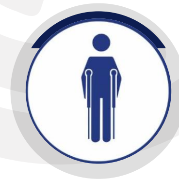
PESSOAS COM MOBILIDADE REDUZIDA