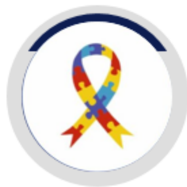
PESSOAS COM TRANSTORNO DO ESPECTRO AUTISTA