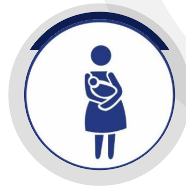
PESSOAS COM CRIANÇAS DE COLO E LACTANTES